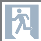
Notlicht-Ausführungen Emergency Options 474