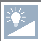
Dimmbare Versionen Dimmable Versions 472