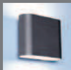
Alternative Oberflächen Alternative surfaces 469