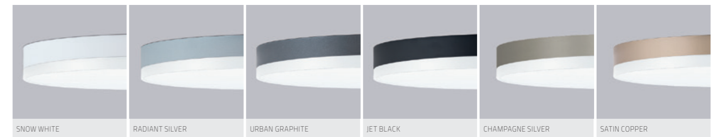
SNOW WHITE RADIANT SILVER URBAN GRAPHITE JET BLACK CHAMPAGNE SILVER SATIN COPPER

Lumen Values: Luminaire luminous flux at 4000K/CRI>80. Other configurations on request.