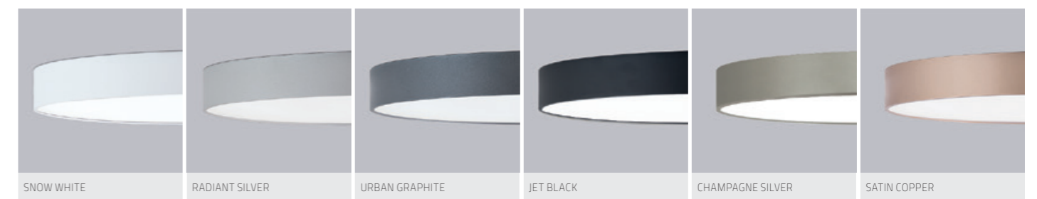
SNOW WHITE RADIANT SILVER URBAN GRAPHITE JET BLACK CHAMPAGNE SILVER SATIN COPPER

Lumen Values: Luminaire luminous flux at 4000K/CRI>80. Other configurations on request.