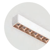
W Snow White K Satin Copper