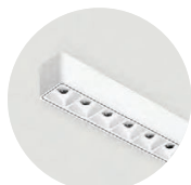
W Snow White W Snow White