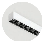
W Snow White B Jet Black