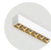
W Snow White G Satin Gold