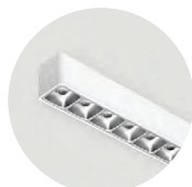
W Snow White A Satin Silver