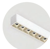
W Snow White H Anodic Champagne