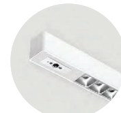
Multisensor / HCL / Swarm Control